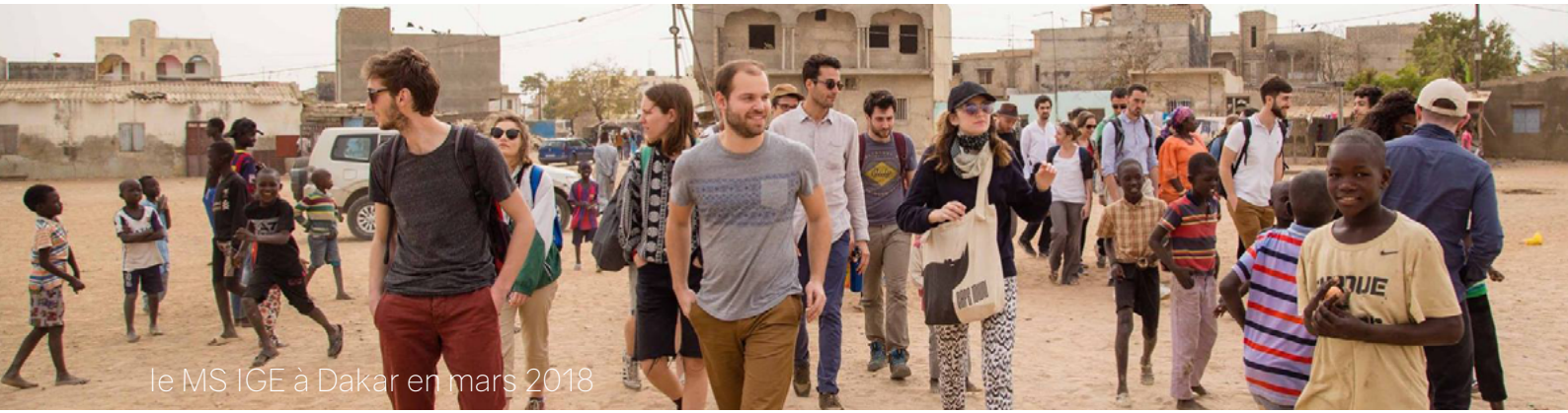
le MS IGE à Dakar en mars 2018